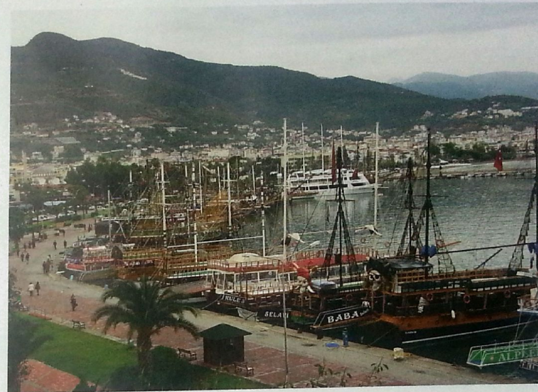
Die Gulet-Flotte wartet auf die Touristen.