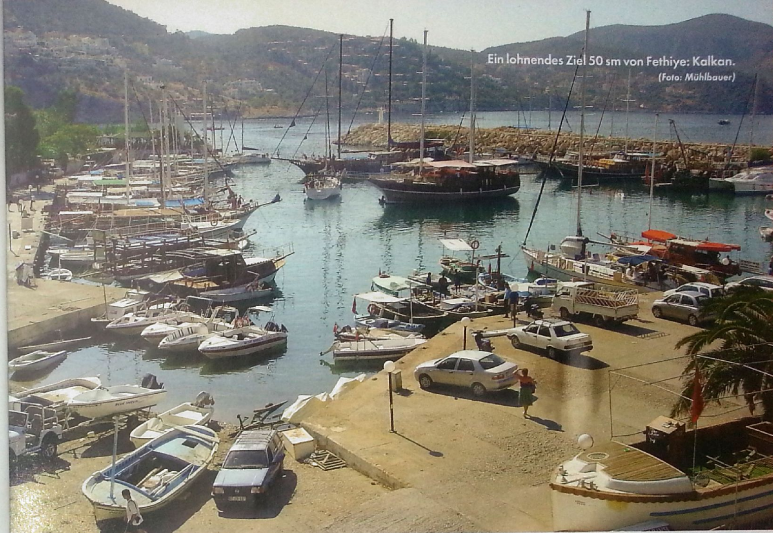
Ein lohnendes Ziel 50 sm von Fethiye: Kalkan.

An der Backbordseite der Hafeneinfahrt von Kastelorizon erinnert das Minarett an die Epoche, als die Türken hier herrschten. Drinnen winkt der christliche Kirchturm inmitten des Dorfes. An der Waterfront ist genügend Platz – heute sogar zum Längsseits-Festmachen. Ein freundlicher Wirt ist schnell gefunden, und schon bald zischt ein tieferer Nemea durch unsere Kehlen, und Tsatsiki, griechischer Bauernsalat, Taramasalata, Mousaka und das süßliche Stifado stillen unseren Hunger.