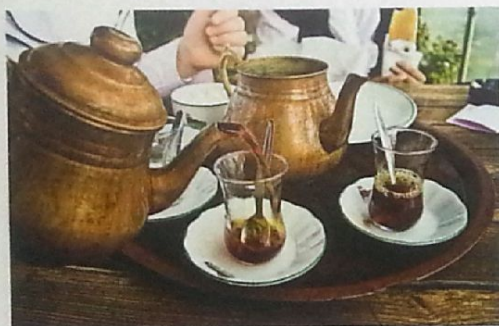
Typisch türkisch: Teezeremonie.

Am Morgen holen wir aus zum 55-Meilen-Schlag. Kalkan sparen wir uns für die Rückreise auf, aber die neue Marina von Kas ist das Tagesziel. Dieser Yachthafen ist nagelneu und schmiegelt sich entlang der Küstenlinie in der gut geschützten Bucht nördlich des alten Hafens und der Ortschaft. Liegeplätze gibt es noch genügend,