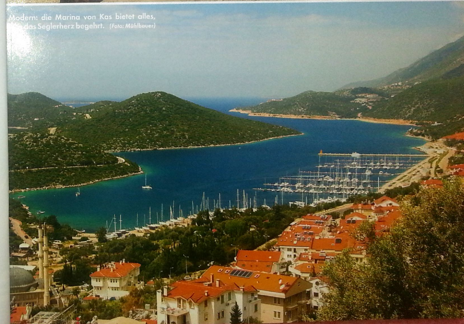
Modern: die Marina von Kas bietet alles, das Seglerherz begehrt.