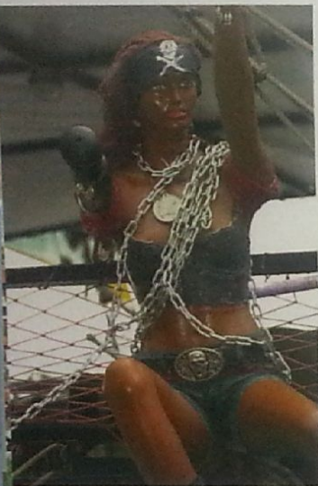
Die Piratenbraut gehört zu den Piratenschiffen im alten Hafen von Antalya.