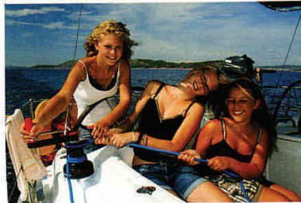
Die Crew legt sich mit Spaß ins Zeug.

Die Seglercrew ist mit dem Flieger von Deutschland aus direkt nach Zadar geflogen - auch der Airport von Split liegt nur gut 100 Autokilometer entfernt, die über die schnelle Küstenautobahn