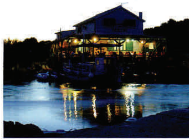
Eine Konoba, die zum Verweilen einlädt. Es gibt einige schöne Stellen, die Urlauber anlaufen sollten.

Nach dem Schwimmen am Morgen, und nach dem Frühstück im Cockpit, regt sich pünktlich, so gegen halb zehn, der Maestral, der sommerliche Schönwetterwind. Auf dem Raumschotskurs nach Ost werden jede Menge kleiner Inselchen passiert – Schade eigentlich, denn jede hat ihren eigenen Charme, ihre unverwech-