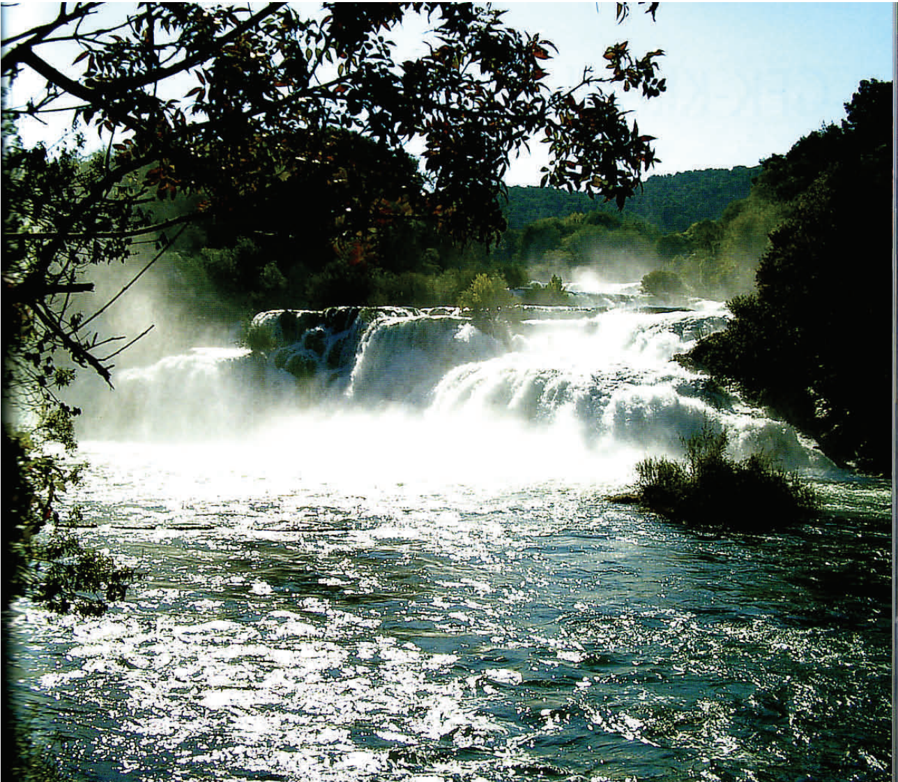
Der Wasserfall von Krka lockt viele Kroatien-Besucher und zeigt sich dennoch idyllisch einsam.