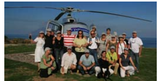
HELIFLUG - Kann ins Rahmenprogramm passen