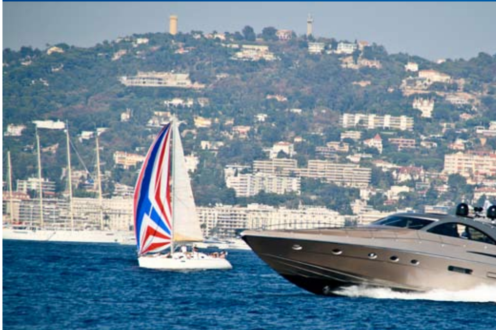
GLEICH VIER „EVENTLOCATIONS“ - Rassistige Motoryacht, sportliche Segelyacht, die exclusive Star Clipper, vor Cannes

Maritime Incentives & Events - Yachtcharter - Mitsegeln - Flottillensegeln - weltweit