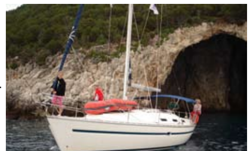
HÖHLE VON MOURTOS - Ne ganze Yacht passt rein!

Hier sind die YouTube-Videos: -->> Meer Info