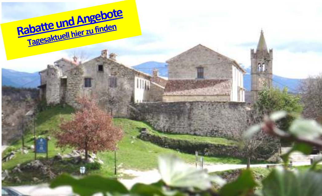
Die kleinste Stadt der Welt— liegt in Istrien: Die „Stadt“ Hum hat ca. 50 Einwohner

Rabatte und Angebote Tagesaktuell hier zu finden