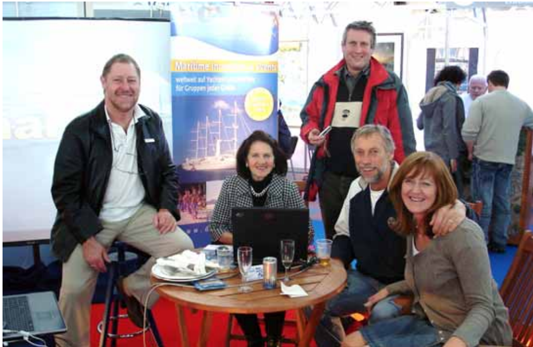
Crewtreff am Messestand — Geschichten vom letzten Törn, und Törnplanung für die kommende Saison