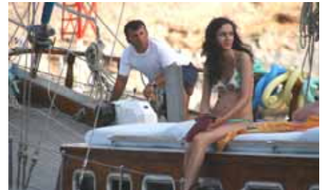
Beauty an Bord — interessiert beim Anlegen

Buchen Sie direkt in der Suchmaschine Ihre Wunschyacht online, und Sie bekommen das Buch „Yachtcharter“ - Praxiswissen für den unbeschwertten Chartertörn, als unser Dankeschön-Geschenk mit dazu! —>> Meer-Info