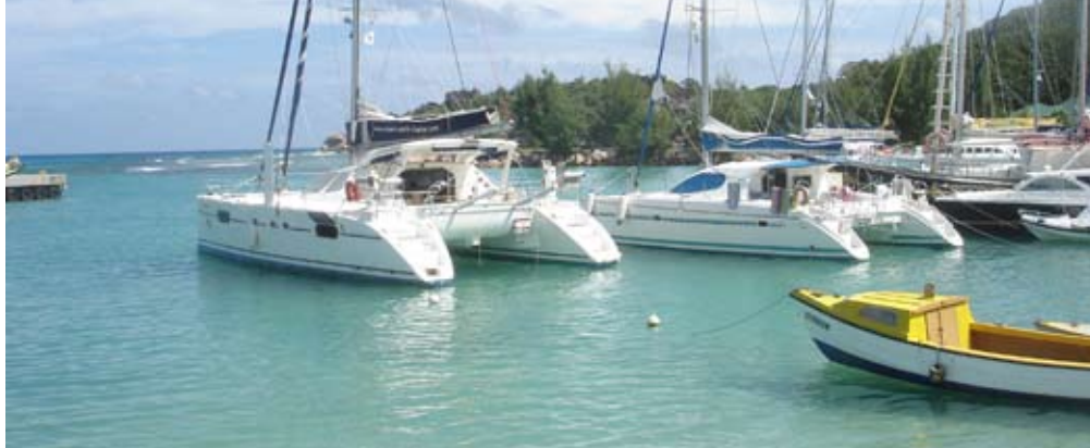
SEYCHELLEN - Ankerplatz für sportliche Katamarane und Yachten im kleinen Hafen von La Dique

Ein Frohes Weihnachtsfest und nen Guten Rutsch wünscht das Team von DMC-Reisen!