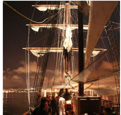
AFTER-SAIL-PARTY: Stilvoll dinieren und feiern