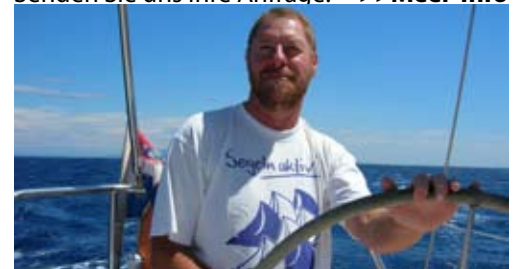
NAVIGATION IST: Wenn man's gemeinsam schafft!

Senden Sie uns Ihre Anfrage: -->>Meer-Info