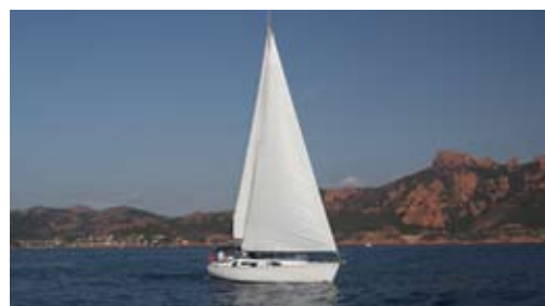
SEGELN - Somme