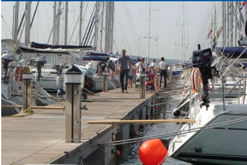
CHARTERYACHTEN AM STEG- Rund 10.000 kleine und große Schiffe weltweit

Yachtcharter - Mitsegeln - Flottillensegeln - Maritime Incentives & Events - weltweit